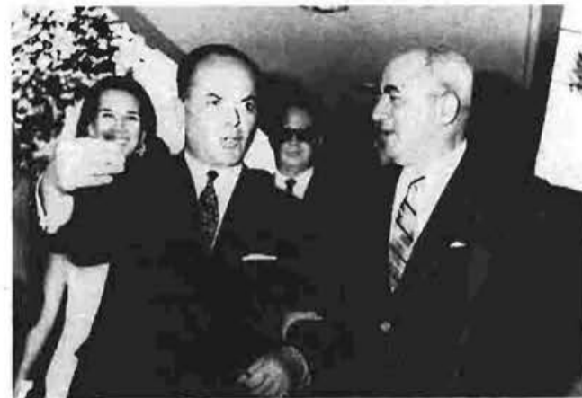
Ο Τομ Πάπας (πάνω δεξιά) παρέδωσε σε μετρητά στον Νίξον (κάτω δεξιά) και στον Αγκβιου (κάτω αριστερά) τα «δώρα» από τους ηγέτες της ελληνικής στρατιωτικής κούντας