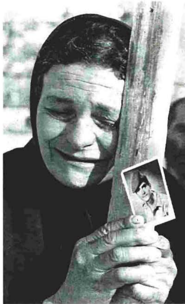
Το μίσος των χουντικών για τον Αρχιεπίσκοπο Μακάριο άνοιξε την πόρτα στους Τούρκους για την εισβολή και το συνεχιζόμενο ως σήμερα δράμα της Κύπρου. Κάποιοι Αμερικανοί προειδοποιούσαν...